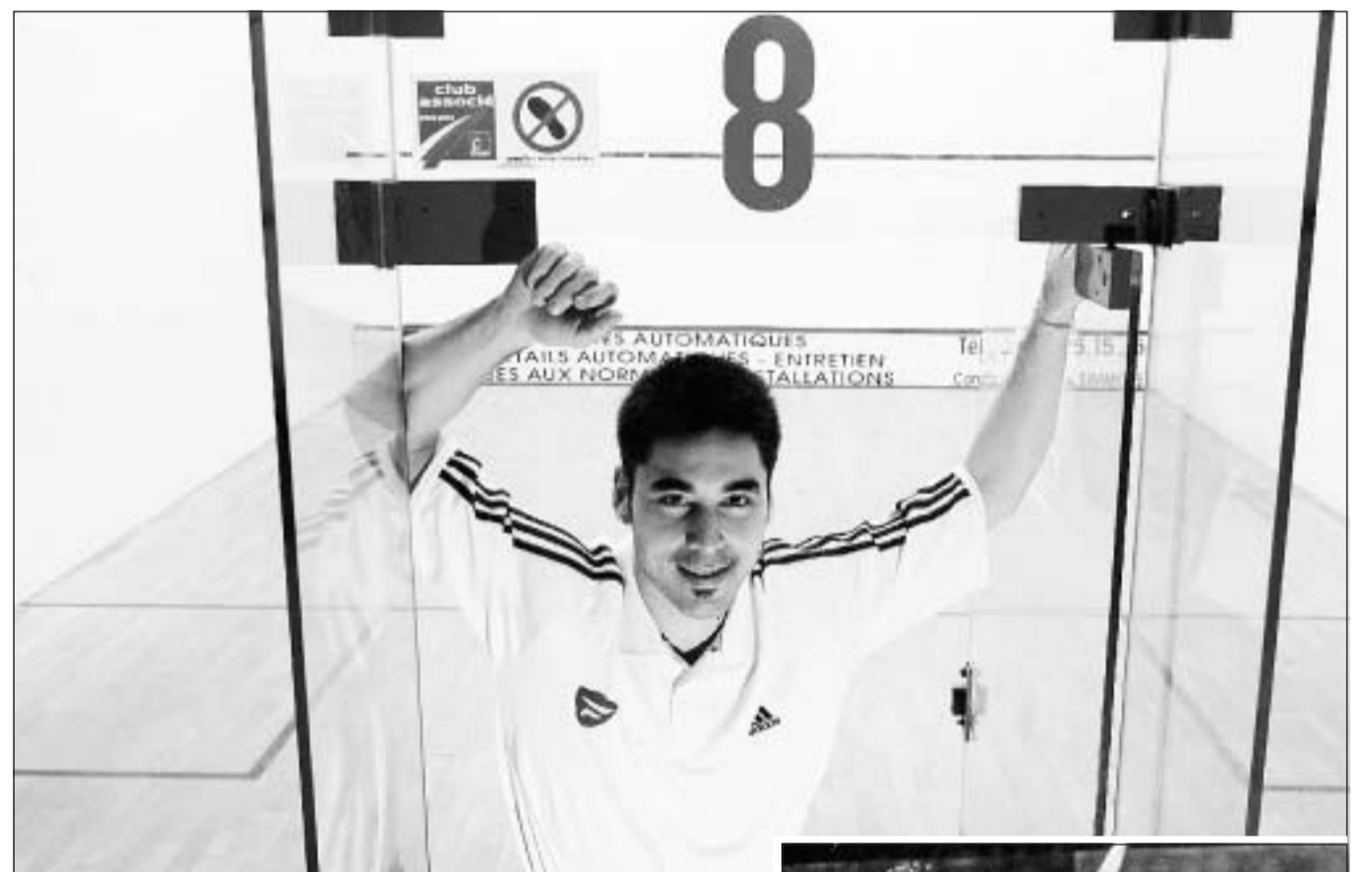
A 27 ans, le Marseillais a pris une nouvelle dimension en décrochant la première place du classement mondial.